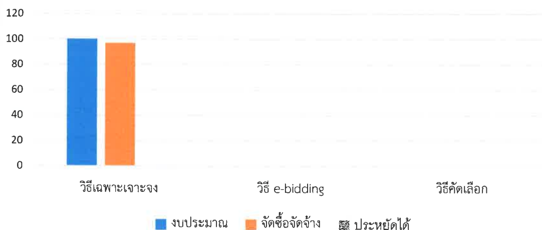
แผนภูมิแสดงงบประมาณ แยกตามวิธีจัดซื้อจัดจ้าง ประจำปีงบประมาณ 2565

จากตารางข้างต้นพบว่า วงเงินงบประมาณที่ใช้ในการดำเนินการจัดซื้อจัดจ้างมากที่สุด วิธีเฉพาะเจาะจง เป็นจำนวนเงิน 1,714,444.34 บาท คิดเป็นร้อยละ 100 สามารถประหยัดงบประมาณได้ 3,900.00 บาท คิดเป็น ร้อยละ 0.22 ของงบประมาณทั้งหมด